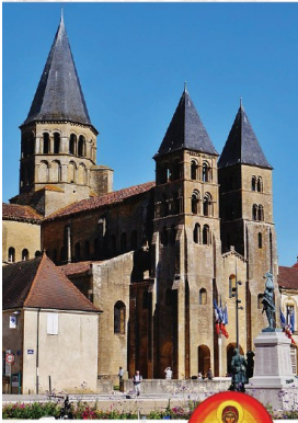
Gemeenschap Emmanuel 10 t/m 15 juni 2019