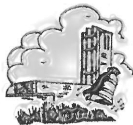
De Goede Herder

Jaargang 2 ♦ nummer 1 Periode 19 december 2020 t/m 17 januari 2021