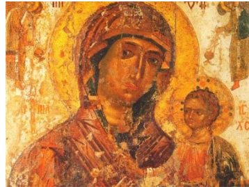
Maria Theotokos: Russisch icoon uit de vroege 14e eeuw

Bijna elke zichzelf respecterende middeleeuwse of oudere stad heeft wel een Maria- of Onze-Lieve-Vrouwekerk. Haar verering komt op gang sinds zij in 431 op het Oecumenisch Concilie van Efeze wordt uitgeroepen tot Moeder van God: 'theo-tokos', God-barend.