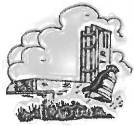
De Goede Herder

Jaargang 1 ♦ nummer 3 Periode 26 september t/m 23 oktober 2020