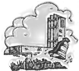
De Goede Herder

Jaargang 2 ♦ nummer 4 Periode 3 april t/m 16 mei 2021